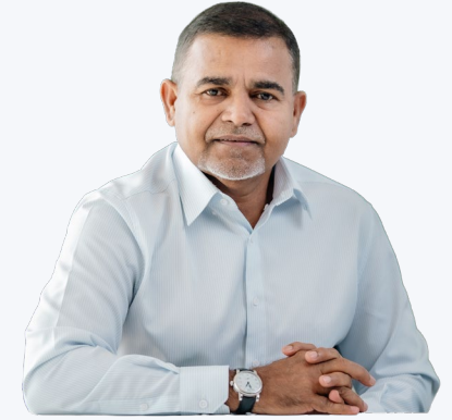
ڈائریکٹر ایگزیکٹو ایگزیکٹو