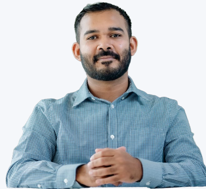
ڈائریکٹر ایگزیکٹو ایگزیکٹو