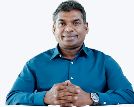
چیئرمین ایگزیکٹو ڈائریکٹرز