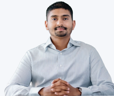
چیئرمین ڈائریکٹر ایگزیکٹو