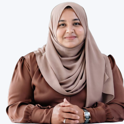
چیئرمین ایگزیکٹو ڈائریکٹرز